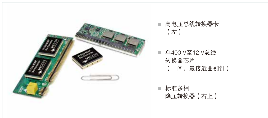
图3. 采用380VDC配电的 负载点标准解决方案实例

配电网络设计是最先进测试系统的一个挑战。它存在一些权衡，需要仔细评估选择的电源系统架构。虽然来自48V背板的分布式电源架构是今天的常见选择，诸如来自400V DC配电的分比式电源等先进架构正变得越来越有价值，因为它们可以通过提供更高的效率和更高级别的精度来提高系统密度。图3显示了一个针对400V DC配电负载点供电的标准两级设计的实例：在左边，一个前端模块包括两个400V总线转换器（在散热片下有一个靠近所示曲别针的模块）；在上部，是一个多相稳压模块（VRM），采用了经典的12 V降压转换器方法。